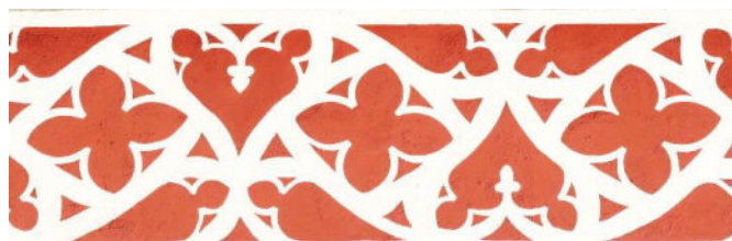
Links: Malerarbeiten 2017 bis in 33 Meter Höhe. Auch der prächtige Fries, (oben unter dem Dach an der Kirchaußenwand), erstrahlt seither wieder in neuen Farben.

Für das bevorstehende Weihnachtsfest und für das Neue Jahr wünsche ich allen Leserinnen und Lesern eine friedvolle Zeit und Gesundheit (oder gute Besserung) !