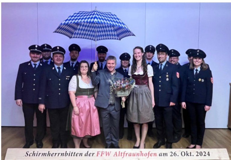
Schirmherrnbitten der FFW Altfraunhofen am 26. Okt. 2024

Zum krönenden Abschluss knieten die Mitglieder des Festausschusses traditionell auf einem Holzscheidl, um dem Bürgermeister ihre tiefe Verbundenheit und den Respekt gegenüber der Bedeutung seiner Entscheidung zu zeigen. Erst als Bürgermeister Johann Schreff, sichtlich gerührt von der Hingabe und dem Engagement der Feuerwehr, sein erlösendes "Ja" sprach, war die Schirmherrschaft gesichert. Mit Schreff als Schirmherr blickt die Freiwillige Feuerwehr Altfraunhofen nun freudig auf das bevorstehende Festjahr 2025 und die Feierlichkeiten zum 150-jährigen Bestehen der Wehr. Die Vorbereitungen laufen bereits auf Hochtouren, und das Schirmherrnbitten war ein weiterer Meilenstein auf dem Weg zu einem unvergesslichen Jubiläum.